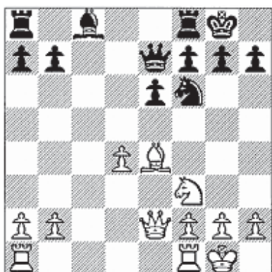
▲ Diagram 1.

Niks mis mee, maar 4 Pgf3 en 4 Ld3 worden vaker gespeeld.